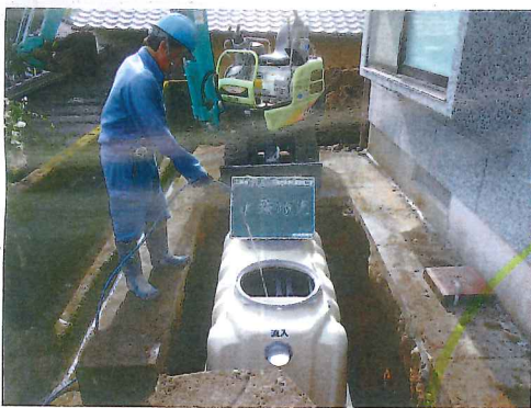
浄化槽は短工期で設置でき、災害にも強い

都会から地方への移住を考える人は少なくない。だが、そこにはいくつかの壁がある。住宅、就業、収入、医療、教育。「下水道がなく汚水処理ができない」という問題もその一つだ。生活排水を側溝に流す「雑排水未処理世帯人口」は2014年末現在で1300万人。10月1日の「浄化槽の日」には、全国で汚水処理率の向上を目指すイベントが開催された(関連2面・3面)。